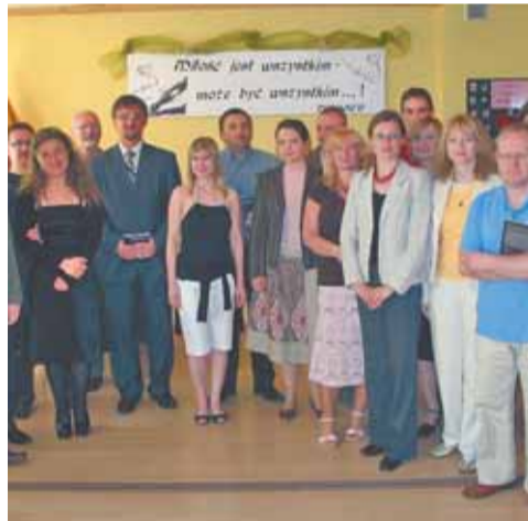
Laureaci jubileuszowej X edycji konkursu

Miłość niejedno ma imię – finał konkursu poetyckiego