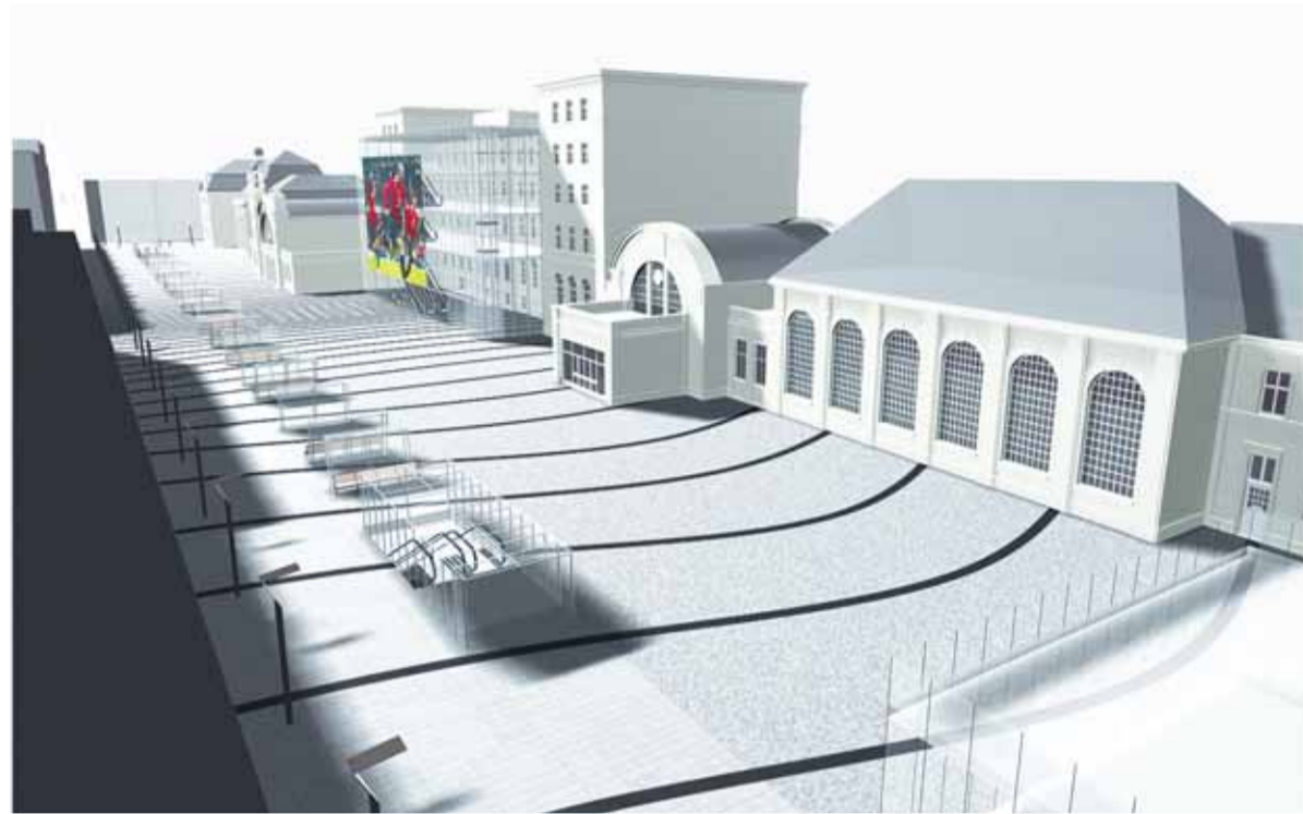
Wizualizacja ul. Dworcowej po modernizacji

W sytuacji, gdy już za chwilę centrum miasta stanie się jednym wielkim placem budowy, a część ulic zostanie zamknięta dla ruchu kołowego, tramwaje i autobusy będą jedynym optymalnym rozwiązaniem, zwłaszcza jeśli chcemy uniknąć korków. Aby więc zachęcić mieszkańców i przyjezdnych do pozostawiania samochodów na terenach oddalonych o 1-1,5 km od