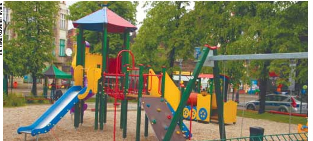
Jeden z nowych placów zabaw usytuowany w Zależu przy Szkole Podstawowej nr 20. Mimo że deszczowa aura nieco pokrzyżowała plany artystyczne, wszyscy cieszyli się z nowego obiektu.

Koszt wykonania jednego placu zabaw o powierzchni minimum 560 m 2 oszacowano na 150 tys. zł. ● (mm)