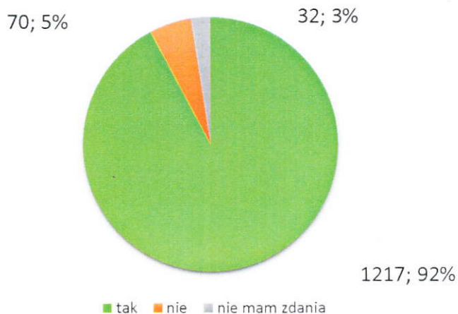
Czy jest Pan(i) za wstąpieniem miasta Katowice do związku metropolitalnego?

92% ogółu badanych - 1217 osób - popiera wstąpienie miasta Katowice do związku metropolitalnego. 70 osób wyraziło swój sprzeciw wobec takich planów, a 32 osoby nie mają zdania na ten temat.