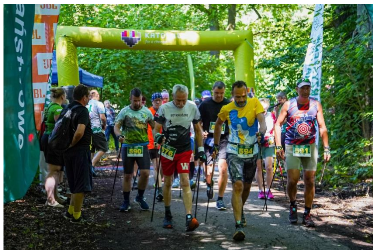
„V Półmaraton Gęstwiniami Murckowskimi”