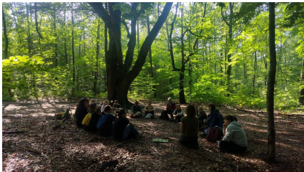
„Giszodrzew – warsztaty w przyrodzie”