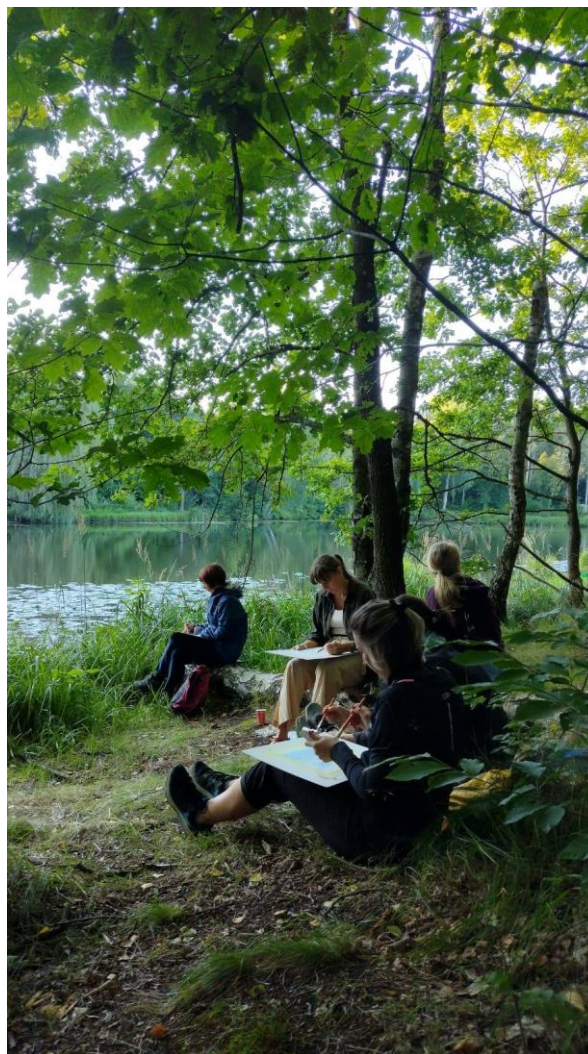
„Giszdrzew – warsztaty w przyrodzie”

Jeśli inicjatywa lokalna zostanie przyjęta do realizacji, wspólnie z pracownikiem Urzędu Miasta Katowice lub jednostki miejskiej doprecyzujecie kosztorys i harmonogram, a następnie zostanie podpisana umowa. Na tym etapie każda ze stron może odstąpić od podpisania umowy, jeżeli uzna, że realizacja pomysłu jest niemożliwa z różnych przyczyn.