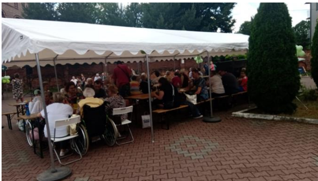
„Parafialny Dzień Chorego. IV dzielnicowa Senioriada – zdrowo, bezpiecznie i solidarnie”

Np. przy remoncie podwórka mieszkańcy mogą wykonać prace porządkowe, po remoncie zadbać o zieleń albo zorganizować piknik integracyjny, na który przyniosą upieczone przez siebie ciasta.