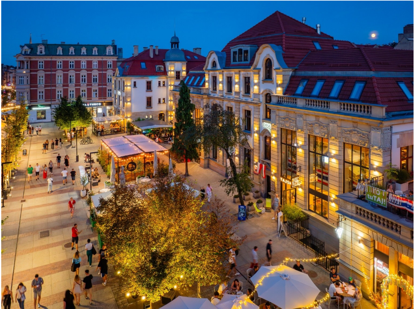
ul. Dworcowa w Katowicach