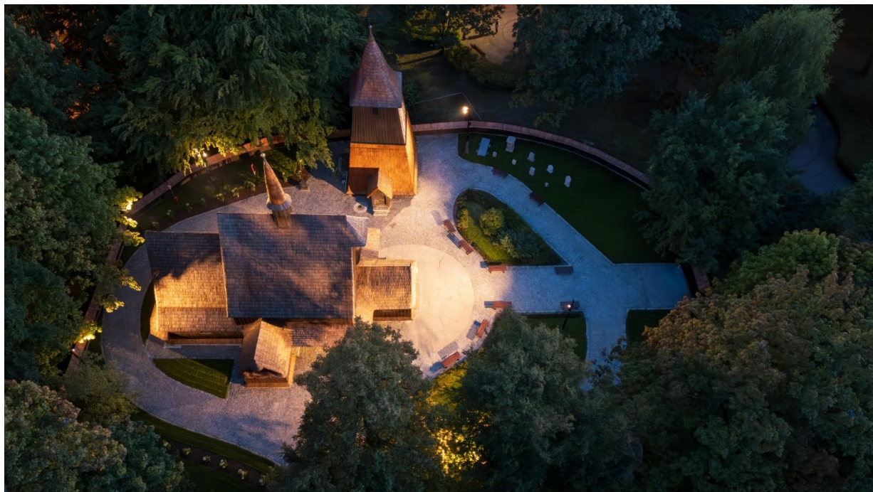
Drewniany kościół pw. św. Michała Archanioła w Parku Kościuszki

Niniejsze pole strategiczne akcentuje znaczenie koncepcji miasta zwartej i tworzenia centrów lokalnych, podkreślając istotność zrównoważonej mobilności, zielonej i rezydentnej infrastruktury oraz wysokiej jakości przestrzeni miejskiej. Pole strategiczne adresowane do użytkowników miasta.