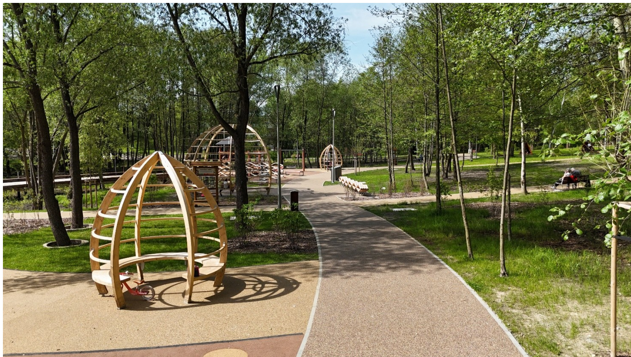
Park Wantuły Kostuchna

Na skutek wzrastającej świadomości zachodzących zmian klimatu na świecie oraz realizacji kierunkowych dokumentów takich jak Agenda 2030 w ramach Strategii Katowice 2030, wprowadzono pole strategiczne, ukierunkowane na ochronę klimatu, zapewnienie zdrowego ekosystemu miejskiego, podnoszenie świadomości klimatycznej i ekologicznej oraz dążenie do zrównoważonej produkcji i konsumpcji. Pole strategiczne adresowane do istot żywych.