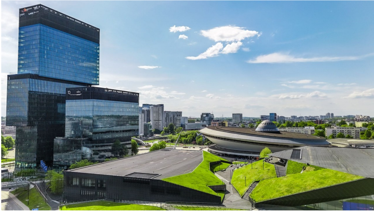
Fot. Kamil Kalkowski. Strefa Kultury w Katowicach

Pole koncentruje się na procesach współdecydowania o rozwoju miast w krajowych i globalnych sieciach współpracy, na wydarzeniach o randze metropolitalnej, na równoważeniu metropolitalności i lokalności oraz na działaniach promujących liderską pozycję w procesach transformacyjnych. Jego adresatami są środowiska liderskie i kreatywne.