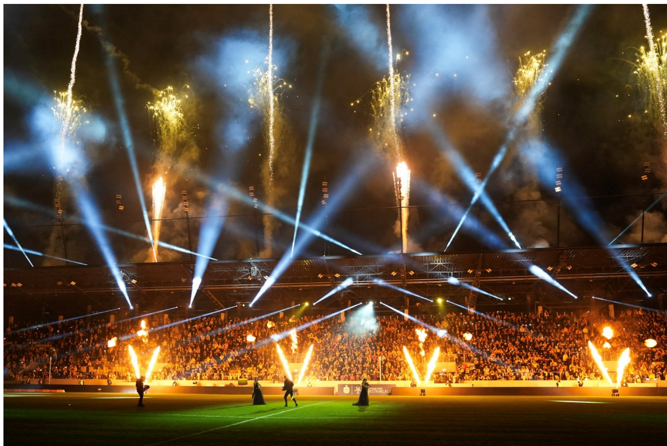
Otwarcie Areny Katowice