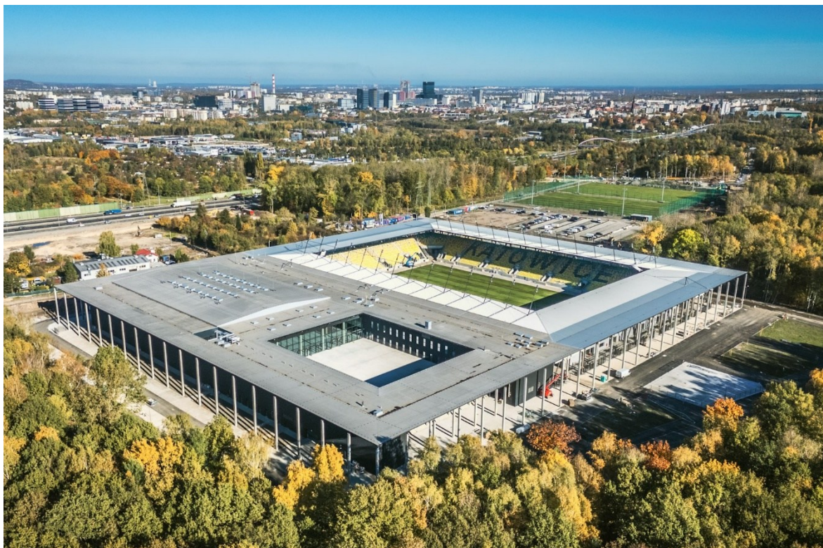
fot. K. Kalkowski – Arena Katowice

Pole to koncentruje się na zagadnieniach związanych z jakością kapitału ludzkiego i edukacją, usługami społecznymi, współzarządzaniem i partycypacją oraz sprawiedliwą transformacją. Jego adresatami są: mieszkańcy, wspólnoty lokalne oraz organizacje pozarządowe.