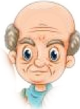
Der Urgroßvater Der Uropa