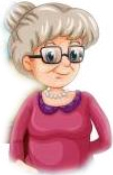
Die Urgroßmutter Die Uroma