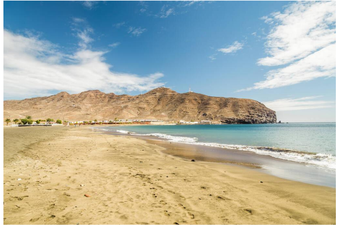
Playa de Gran Tarajal